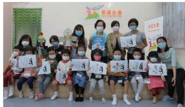
疫情下難得的實體故事活動