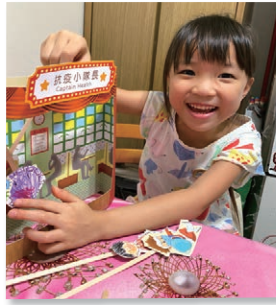
小朋友創作自己的抗疫劇場

收到劇場手工包很開心，因為我很喜歡做手工。我最喜歡《抗疫小隊長》的貓貓消毒俠，因為牠噴消毒液打敗了病毒。我還設計了雙眼會發射激光的病毒紙偶！