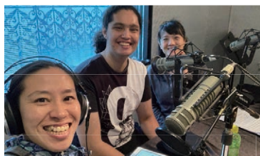
南丫島上街坊製作電台節目，邀請異國文化家庭分享有趣故事