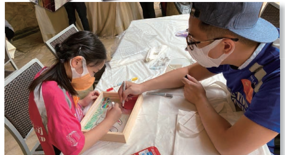
東翹公司義工與孩子一起製作玻璃畫