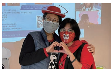
義工用心預備故事道具，以戲劇形式分享故事