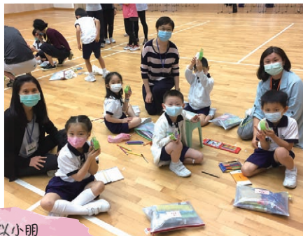
聽完故事後認真製作小手工

“故事姐姐「講得到，做得到」，所以小朋友吸收特別快及容易掌握！在互動方面十分大的啟發！和小孩子的互動的確有很多的 新知識學習到。”——北角衛理小學 家長