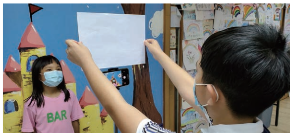
小朋友在疫情期間自己當YouTuber!

本計劃由香港公益金資助 This project is supported by The Community Chest