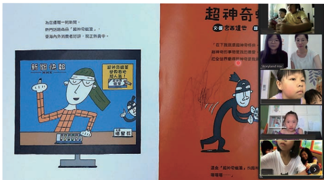
三菱電機贊助網上故事活動

為了讓家長適應網上平台和增加學習的渠道，童話夢工場及故事盒於2021年4月首推網上故事爸媽培訓，希望透過提供豐富及革新課程內容，使到家長可以在家學習，培訓課程更獲得學校及參加者的肯定。2020-2021年度停課日子雖長，我們仍服務逾60間學校及機構，提供教師培訓、家長工作坊和兒童或親子故事活動等。以中心為本的兒童服務因疫情轉為網上舉行，我們盡力為兒童提供多元化的故事及閱讀體驗，包括故事直播、影片拍攝、網上實時小組、預製和派發手工包等，使兒童在安全的環境下仍能體驗故事樂趣。