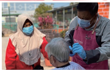
新年前，義工細心地為有需要長者恤個靚髮