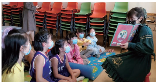
孩子們渴望很久的故事分享會