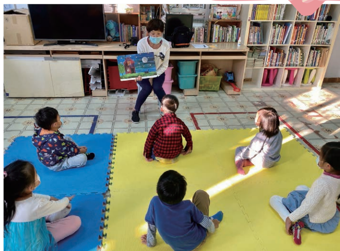
退休導師為小朋友講故事