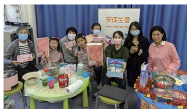
長者及小義工前來童話夢工場，進行新年Facebook直播

本計劃由香港公益金資助 This project is supported by The Community Chest