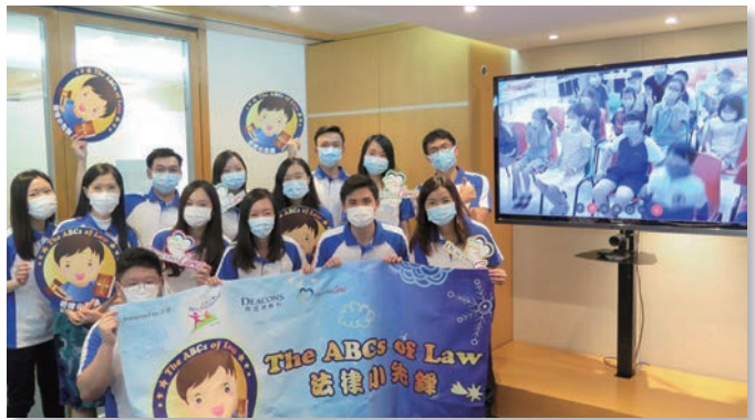
的近律師行義工與參與活動的小朋友於螢幕上合照留念。

安徒生會與的近律師行自2014年起合辦「法律小先鋒」，竹園中心和包威信中心有幸於2020年6月24日亦參與是次活動，共有28位小朋友參與。因疫情關係，的近律師行的律師在辦公室透過網上活動與小朋友互動，以故事形式介紹有關版權及抄襲的相關法律知識，內容生動有趣。相信小朋友參與活動後，能了解香港市民所享有的權利與義務。