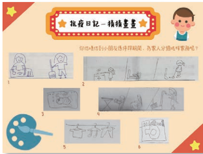
抗疫日記分享疫情下生活點滴

承蒙香港賽馬會慈善信託基金贊助，安徒生會因應新冠肺炎疫情特別企劃「抗疫小隊長」，出版原創電子繪本《抗疫小隊長》，以故事形式向兒童推廣正確防疫知識，點擊率逾4,000次。我們更邀請兒童參與，推出抗疫日記及防疫裝備設計比賽等，反應熱烈。在物資匱乏的日子中，本計劃送出共3,915份防疫用品給低收入家庭，郵寄4,500份「抗疫小劇場」手工包到參加者家中，小朋友利用手工包設計角色紙偶，演出自家的抗疫劇場，活動為停課中的小朋友帶來歡樂及創意。