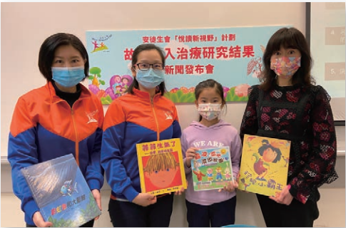
2020年12月舉行記者發布會，公布「故事介入治療」的成效

承蒙香港公益金贊助，本會得以在2020-2023年度擴大服務範圍，除了故事小組以外，亦提供「讓愛走動」學生故事講座及「在繪本中成長」家長工作坊。在2020-2021年度，已有11間小學參與本計劃，學生受惠人次達2,776人。網上故事資源庫「悅讀花園」亦於去年啟用，網站按主題及年齡推介繪本，並以影片分享故事活動及故事技巧，現時網站點擊率已達30,000次。未來，我們將推出家長資源冊，幫助家長從繪本中反思教養方式，以繪本促進與孩子的交流；亦會舉行工作坊，加深教師、社工及兒童工作者對「故事介入治療法」的認識，期望進一步發揮故事的力量。