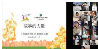
故事的力量超乎我們的想像，Zoom活動吸引了過百對親子參加

除了為學童提供網上閱讀，計劃特別為家長準備了一系列網上工作坊，22次工作坊共有超過1,300人次參與，雙語內容涉及多方面知識，包括閱讀技巧、家教溝通、運動按摩及靜觀反思。