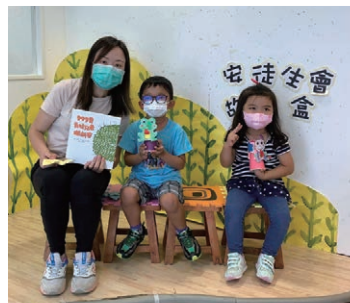
聽完故事一起製作彈跳小青蛙