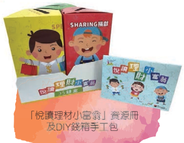
「悅讀理財小富翁」資源冊及DIY錢箱手工包

我們為低收入地區的小學提供免費講座及工作坊，每位參加者可獲贈由本會設計的資源冊及DIY錢箱手工包一份，讓學生學會分配自己的金錢，好好管理自己的財富。